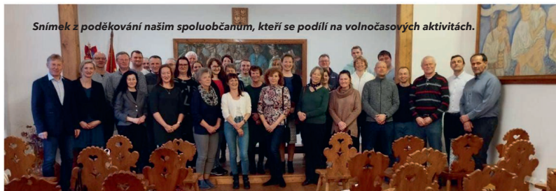
Snímek z poděkování našim spoluobčanům, kteří se podílí na volnočasových aktivitách.